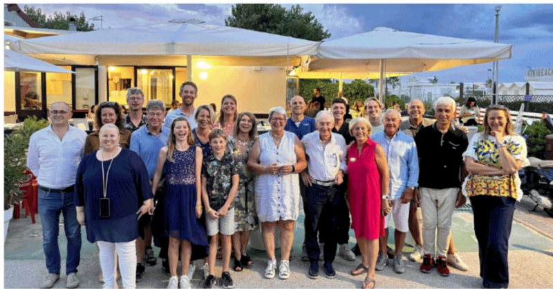
I turisti provenienti dai Paesi Bassi protagonisti dell'iniziativa

venienti dall'Olanda - vincitori del concorso Camping Lovers 2023. Un concorso messo in palio dal Consorzio Camping & Natura Villages, che associa 25 villaggi e campeggi sulla riviera romagnola, grazie alle collaborazioni con la Regione e Apt Servizi. L'esperienza è diventata il fulcro di un programma televisivo dedicato ai campeggi sull'emittente nazionale Rtl4, con dodici episodi in prima serata, che hanno valorizzato le vacanze en plein air sulla riviera romagnola. Al termine della programmazione, le quattro famiglie di telespettatori che si sono aggiudicate la vacanza hanno ora la possibilità di compiere un viaggio premio di 12 giorni nella costa romagnola.