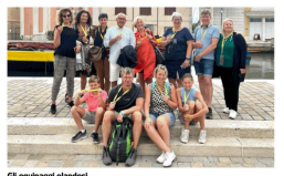
Li segue una tv dei Paesi Bassi

Il viaggio promozionale Olandese è quello di promuovere le località turistiche e territori attraverso diversi canali di comunicazione, incentivando la vacanza en plein air. E così dal 21 agosto al 1° settembre 4 "equipaggi" olandesi, vincitori del concorso "Camping Lovers 2023", che rappresentano diverse categorie turistiche (famiglia, vacanza attiva, enogastronomia e cultura) si sono messi in viaggio ospitati in diversi villaggi e campeggi della Riviera, dove sono state preparate per loro esperienze a tema. Una troupe televisiva olandese ha registrato le vacanze dei 4 equipaggi, dando un video risultato ai luoghi visitati e all'accoglienza. Il materiale girato, prodotto e raccolto sarà utilizzato per la promozione in Olanda e in Belgio, attraverso video, foto, blog e articoli. Inoltre i vincitori dell'Acsi Free Life Test Tour verranno messi in onda sul canale televisivo Rtl4.