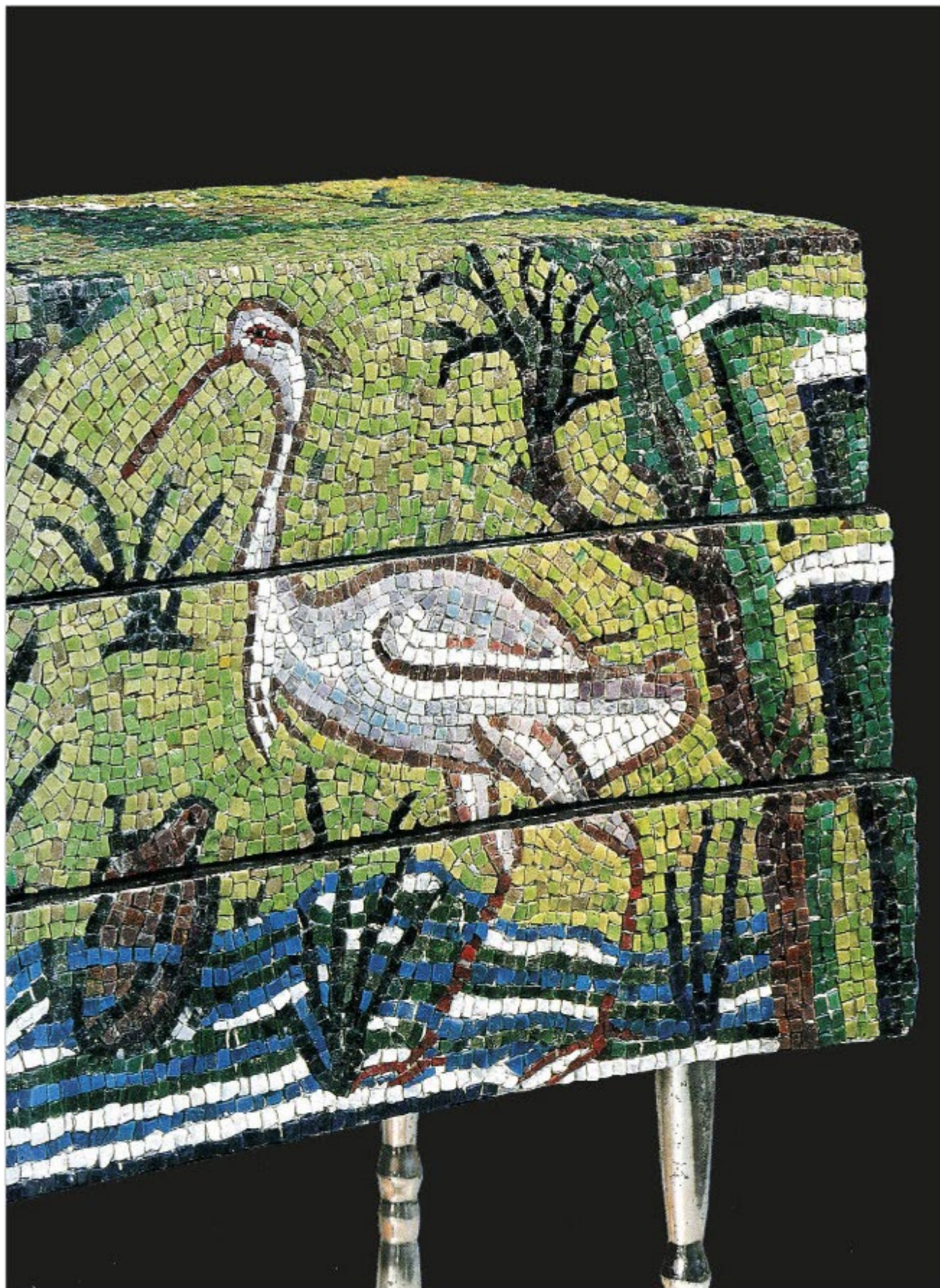
COLLEZIONE MOSAICI CONTEMPORANEI - MAR Museo d'Arte della città di Ravenna Mobile aulico , 1987, Progetto: Giorgio Gregori. Realizzazione: Associazione mosaicisti Ravenna MAR Museo d'Arte della città di Ravenna, via di Roma, 13