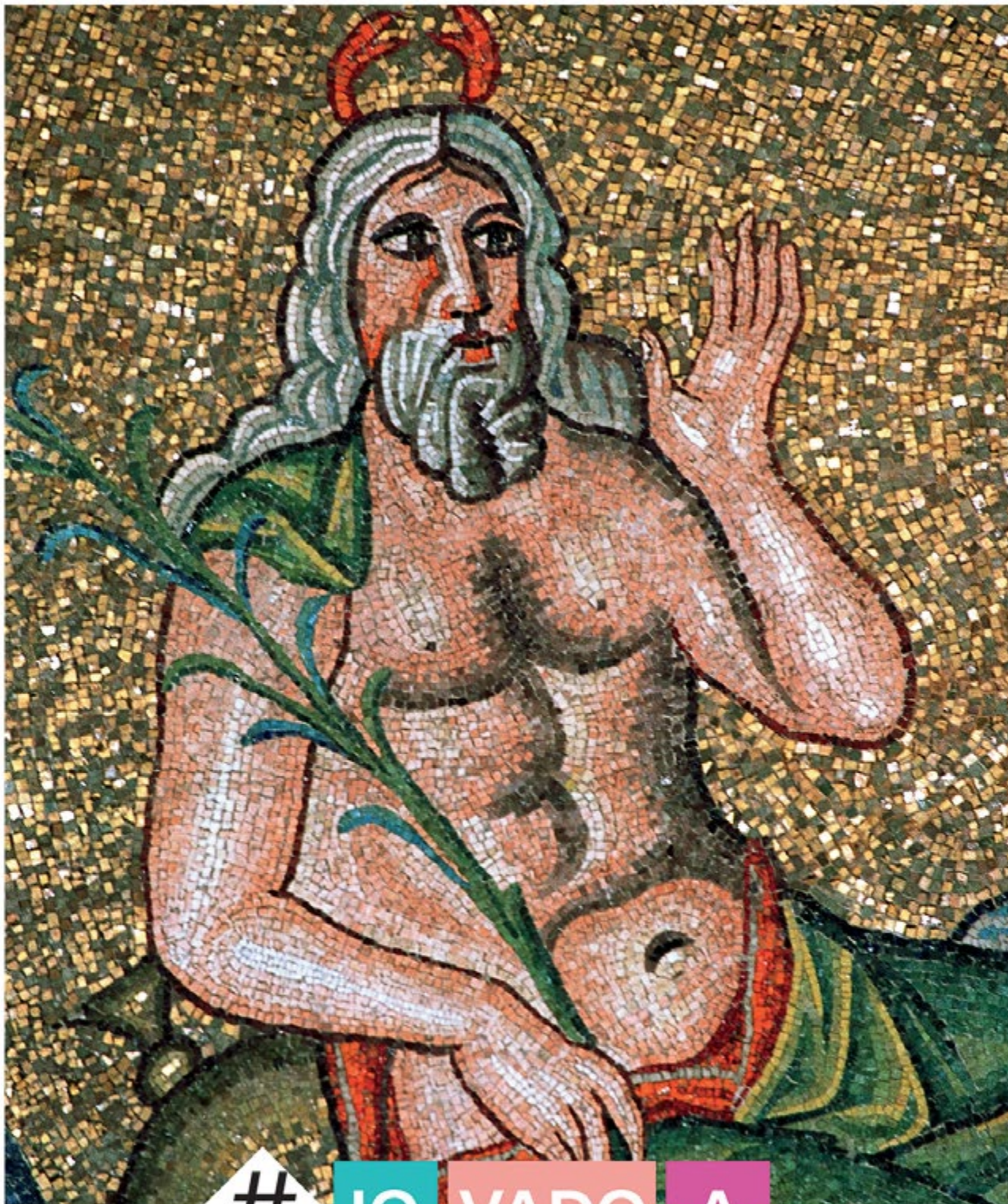
Battistero degli Ariani