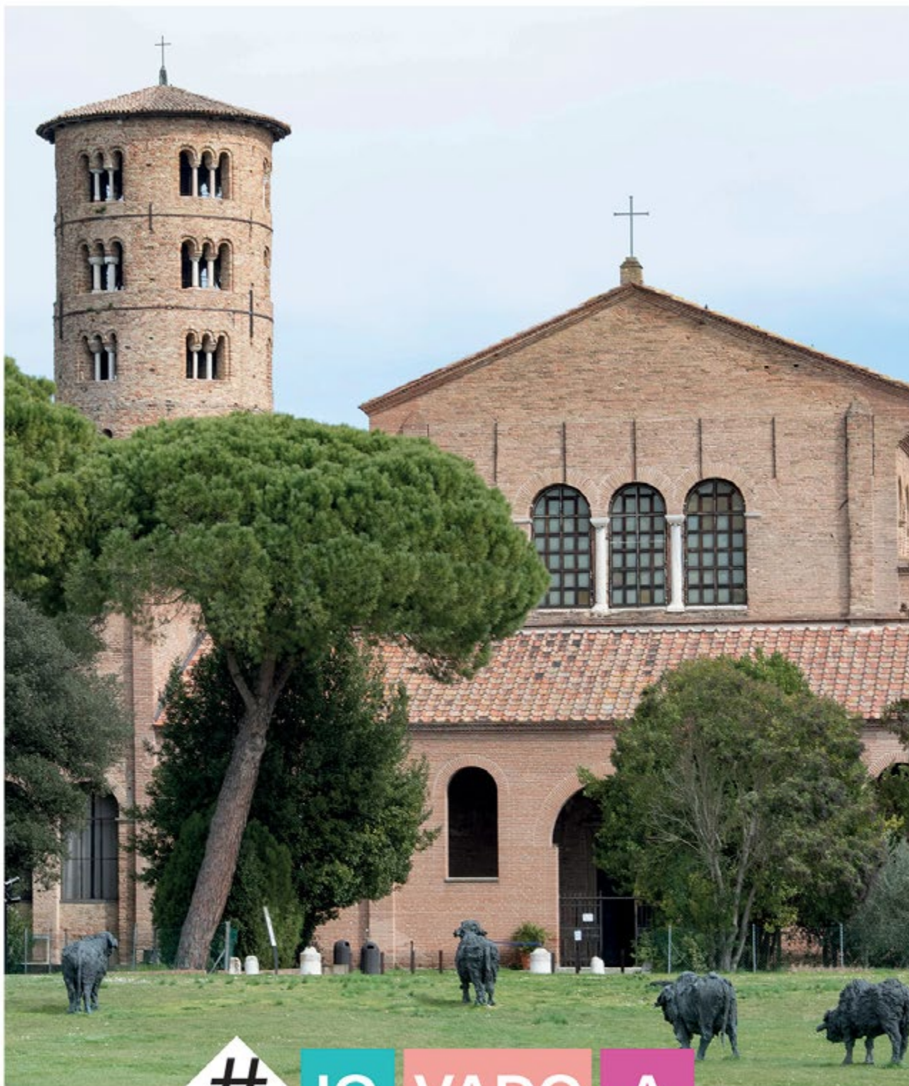
Sant'Apollinare in Classe