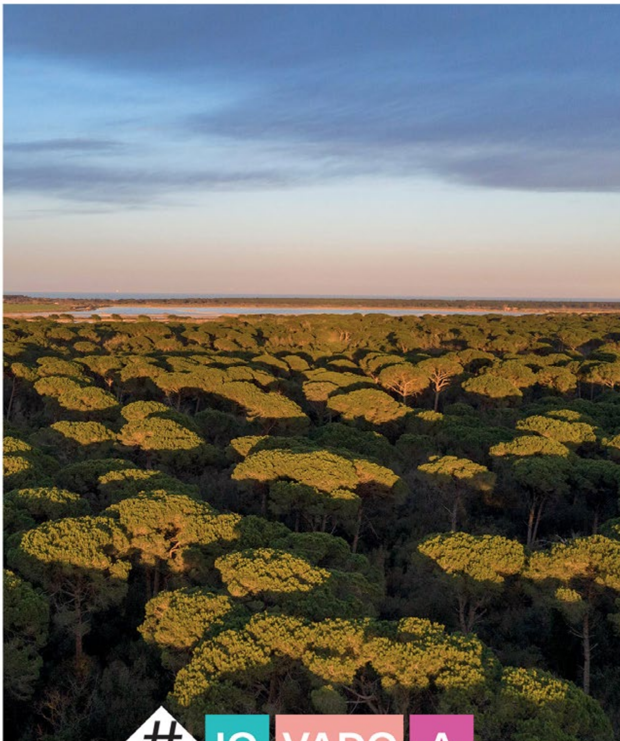
Pineta di Classe