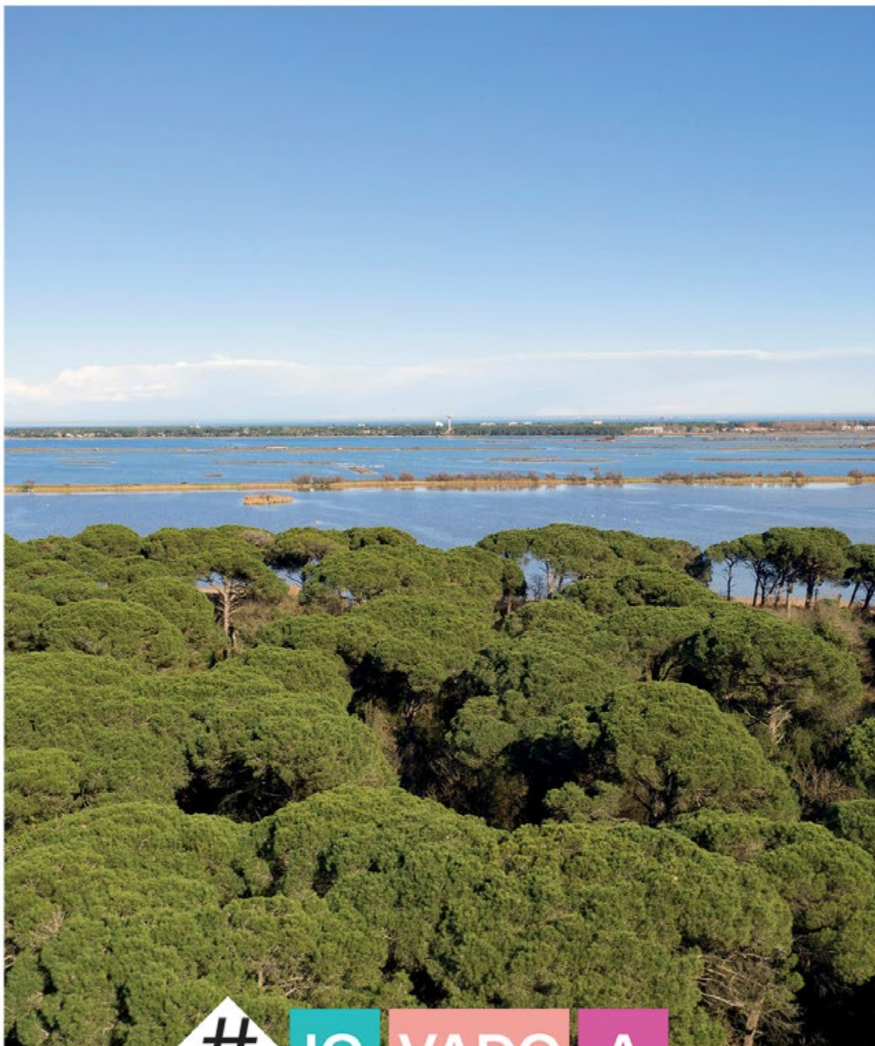
Pineta di San Vitale