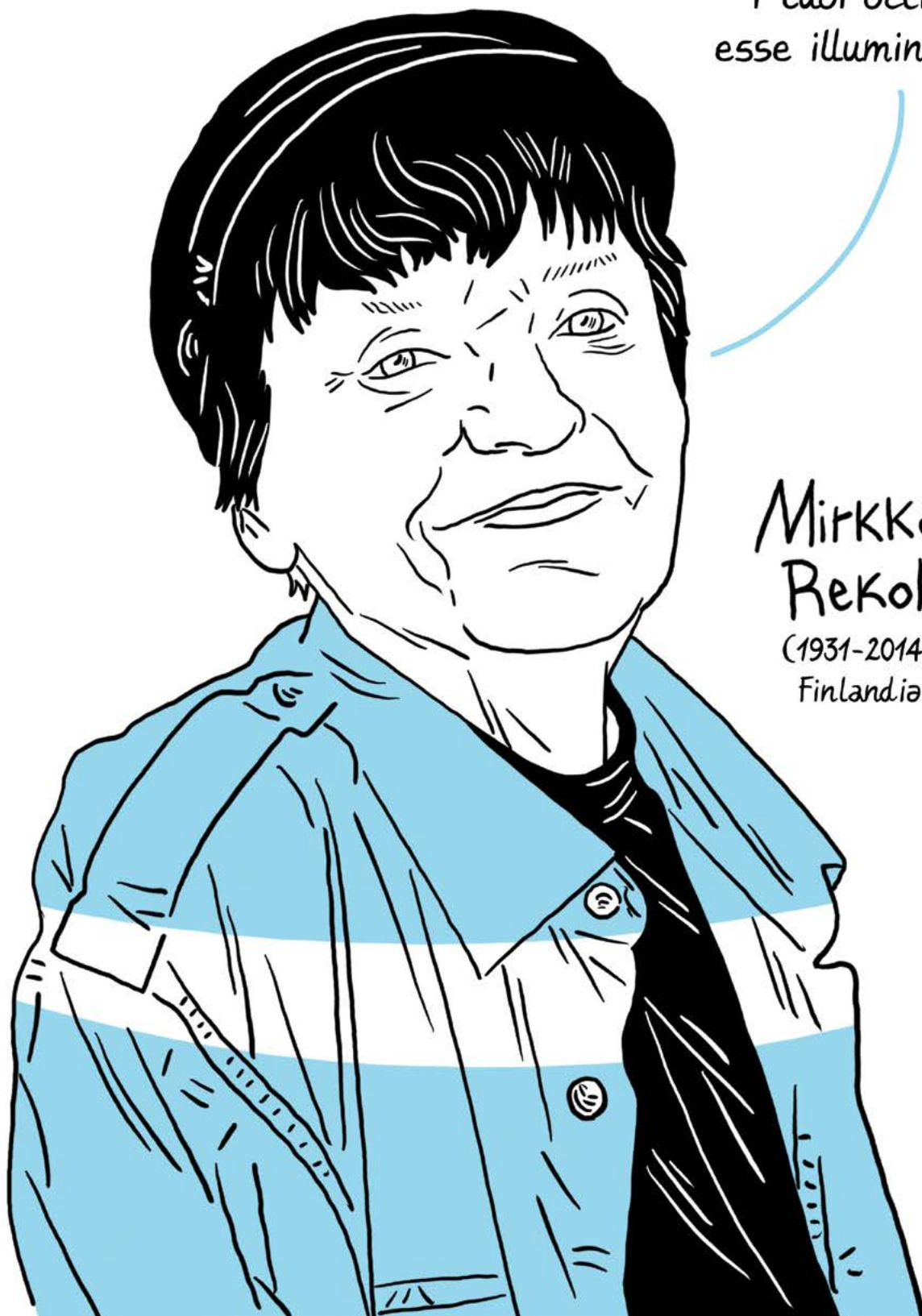
Mirkka Rekola (1931-2014) Finlandia

Appena dai alle parole i tuoi occhi, esse illuminano.