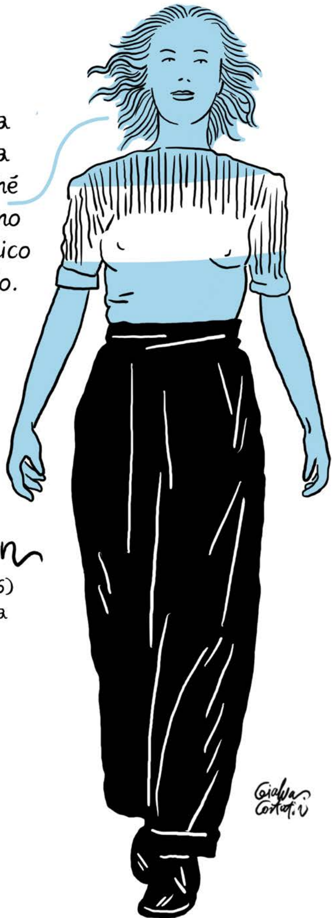
Tove Ditlevsen (1917-1976) Danimarca

Forse dovrei unirmi ai combattenti per la libertà. Penso che sia un'idea stupida, perché le forze occupanti sono così potenti, ma non dico che non sia d'accordo.