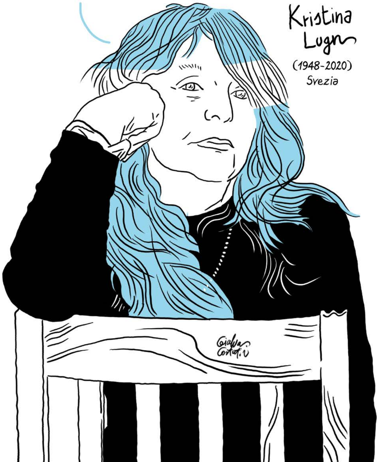
Kristina Lugn (1948-2020) Svezia

Non sono davvero me stessa. E ne sono felice.