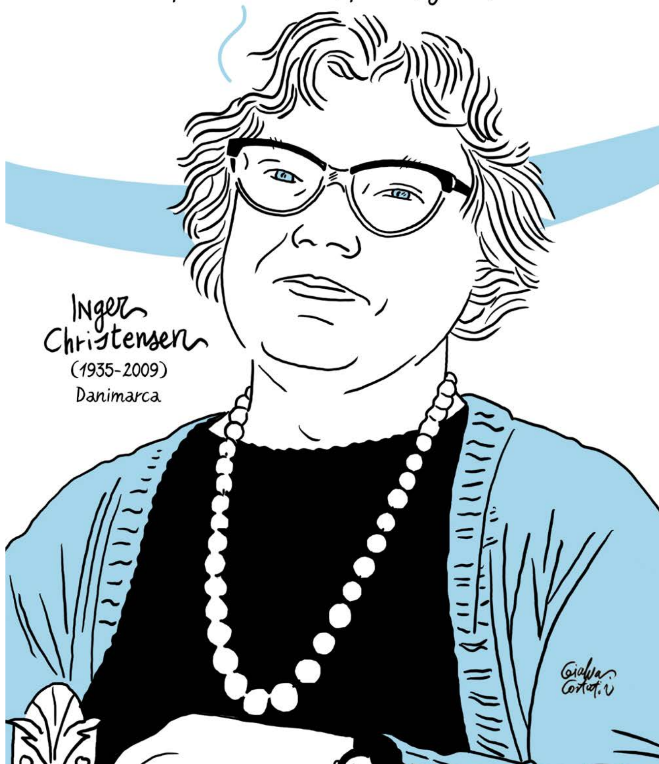
Inger Christensen (1935-2009) Danimarca

Esistono colombe, sognatori e bambole; esistono assassini, e colombe, e colombe; foschia, diossina e giorni; i giorniesistono, giorni e morte; e le poesie esistono; poesie, giorni, morte.