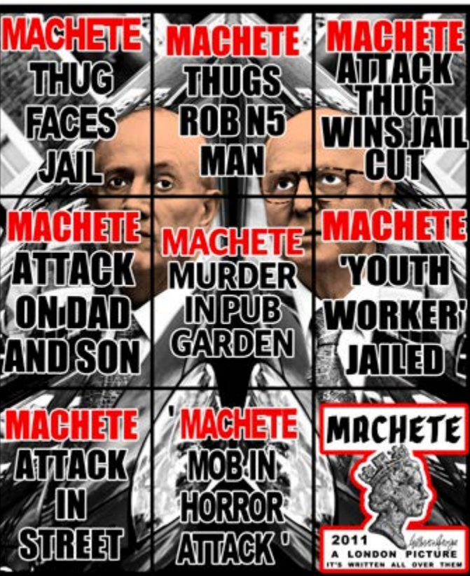
Gilbert & George, Machete , 2011 Galleria Alfonso Artiaco, Napoli

Il progetto espositivo è realizzato grazie al prezioso contributo della Fondazione del Monte di Bologna e Ravenna, Edison, Marcegaglia, IBC e Regione Emilia-Romagna e si articola intorno a tre temi.