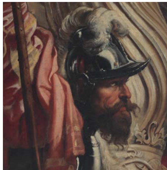
Pieter Paul Rubens, Alabardiere (part.) , 1605 Complesso Museale Palazzo Ducale, Mantova