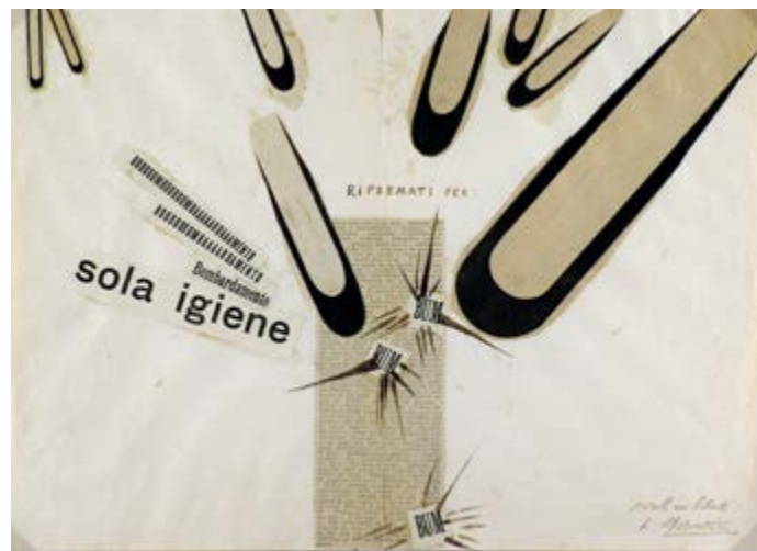
Filippo Tommaso Marinetti, Parole in libertà (Bombardamento sola igiene) , 1915 Collezioni d'Arte e di Storia della Fondazione Cassa di Risparmio in Bologna

Le scelte curatoriali di Angela Tecce e il contrappunto filosofico e letterario di Maurizio Tarantino si completano con le installazioni di Studio Azzurro , che creano un ideale trait-d'union tra i vari temi affrontati.