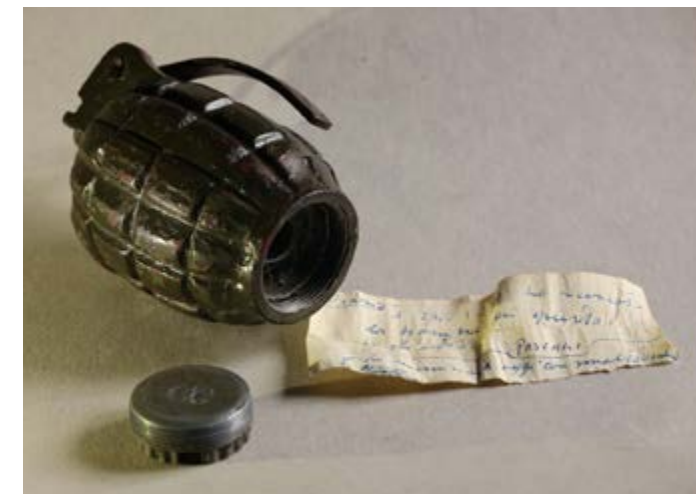
Pino Pascali, Bomba a mano (diario) , 1967 Collezione privata, Roma

There is no peace without war and no war without peace. This seems the inevitable way to tackle the problem, but the exhibition will offer another point of view: the opposite of war is not peace, but dialogue, controlled conflict, dialectics. The hub of the exhibition is a group of "historical" artists who developed the conflict matters in different and opposite ways, from the war-futurist Italian propaganda by Marinetti to the work I Gladiatori (1922) by De Chirico , who reinterprets the violence of World War through a purified and eternal classical style. Picasso , with the artwork Jeux de pages , 1951, continues the reflection on the disasters of war already started in 1937 with Guernica . Lucio Fontana and Alberto Burri , together with the resonant and indignant voice of Renato Guttuso , express with very different sensibilities the deep wound all the damage of the Second War caused, firstly, in people's consciousness. Other artists on display will be Abramovič , Boetti , Borgnini , Capa , Chapman , Christo , Fabre , Gilbert & George , Giliberti , Giusto , Hirshorn , Jaar , Jodice , Kentridge , Kiefer , Kounellis , Mendieta , Migliora , Neshat , Nitsch , Paladino , Pascali , Pistoletto , Rauschenberg , Rovner , Ruffo , Salvo , Serrano , Tato , Warhol , Wiener . The ideas by the group of artists of Studio Azzurro acted as a glue, giving birth to an installation inspired to the tombstone of Guidarello Guidarelli , the symbol of the collections of MAR.