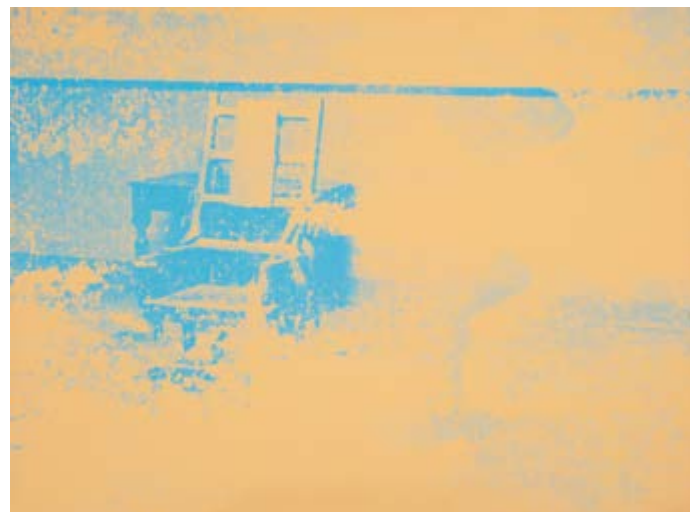
Andy Warhol, Sedia elettrica Courtesy Memmo Grilli © The Andy Warhol Foundation for the Visual Arts Inc. by SIAE 2018

Il fulcro della mostra è costituito da un nucleo di artisti "storici" che hanno declinato le tematiche della guerra in modi diversi, dalla propaganda bellico-futurista di Marinetti a De Chirico che con I gladiatori rilegge la violenza della guerra mondiale con il filtro di una classicità depurata ed eterna. Picasso con Jeux de pages torna a una riflessione sui disastri della guerra iniziata con Guernica .